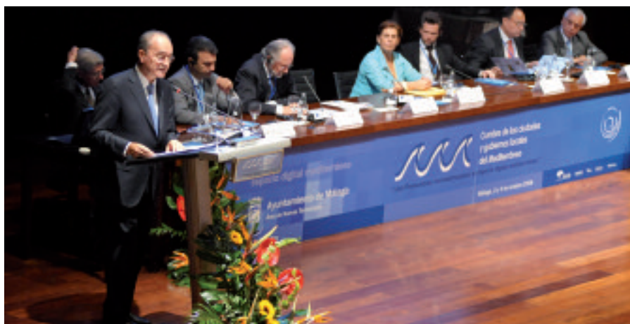
Le maire de Malaga, M. Francisco de la Torre Prados, annonce la création de l'Espace Digital Méditerranéen (EDM) et l'application par Malaga de la « contribution de 1% de solidarité numérique ».

Le Fonds mondial de Solidarité Numérique s'est engagé à apporter son soutien au Secrétariat permanent qui agira dorénavant comme un relais régional pour toutes les actions du Fonds dans la zone méditerranéenne. ■