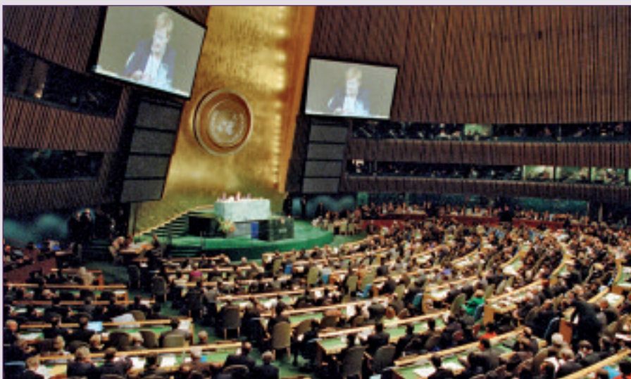
L'espoir de réduire la pauvreté était au rendez-vous lors de la session d'ouverture du Sommet du Millénaire, le 6 septembre 2000 à New York.

Cette volonté, si nécessaire en matière de coopération au développement, des personnalités politiques l'ont pourtant affichée lors du premier « Sommet des Villes et des Pouvoirs Locaux de la Méditerranée » qui vient de se tenir à Málaga. Même si l'événement n'a qu'une portée méditerranéenne, les Suite page 2