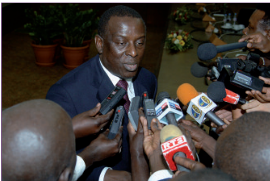
Le Ministre des Affaires étrangères, Cheikh Tidiane Gadio, est le promoteur, au nom du Sénégal, du « 1% de solidarité numérique » au sein du Groupe pilote sur les contributions de solidarité en faveur du développement.

L'initiative sénégalaise doit aussi déterminer les acteurs locaux, les maires et les présidents régionaux du monde entier à appliquer, à leur niveau, cet engagement de solidarité. Prompts aux belles paroles sur le rôle des pouvoirs locaux dans la mondialisation, ces derniers s'abritent trop souvent derrière des raisons administratives pour différer leur engagement. L'éthique de la coopération et de la solidarité exige une attitude beaucoup plus engagée. La Conférence mondiale de Lyon sur la solidarité numérique leur donnera, espérons-le, courage de passer aux actes. ■