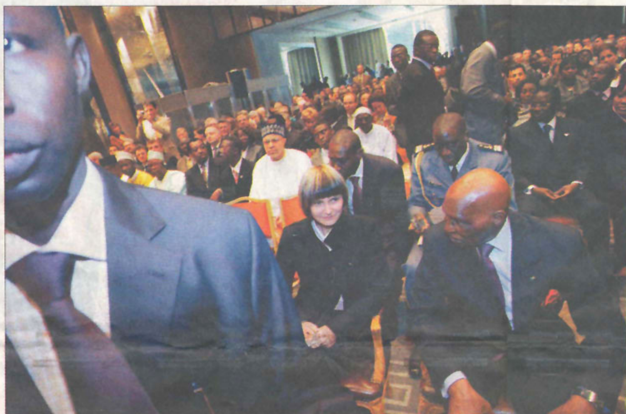
A l'Hôtel Intercontinental, hier lors de la cérémonie d'inauguration du Fonds mondial pour la solidarité numérique. Au premier plan, la conseillère fédérale Micheline Calmy-Rey et le président sénégalais, Abdoulaye Wade.

Au nom des «sans-claviers», une idée simple a germé à partir d'un constat affligeant. Plus de 90% de la population de la planète reste privée d'accès à Internet, exclue des connaissances qui circulent sur les autoroutes de l'information. En Afrique, on compte un ordinateur pour 5000 habitants... On dénombre davantage de téléphones à Manhattan que dans toute l'Afrique subsaharienne. Autant de manifestations des fractures numériques qui menacent la planète. Alors même que les nouvelles technologies sont porteuses en matière de développement et que